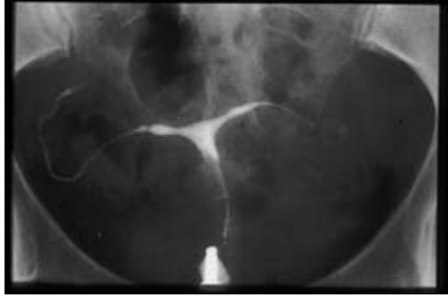
Figure 5 : utérus en T et hypoplasique