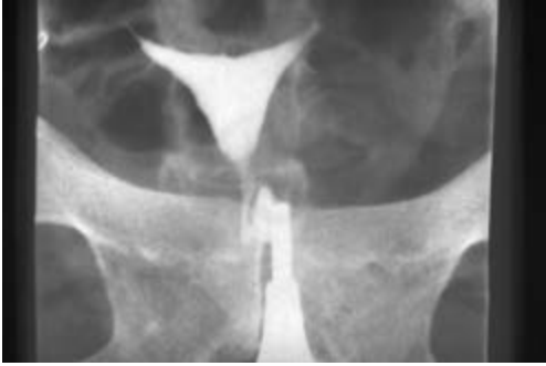
Figure 4 : utérus normal