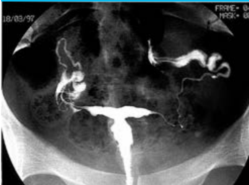
Figure 6 : utérus en T avec bords irréguliers et rétrécissements du corps