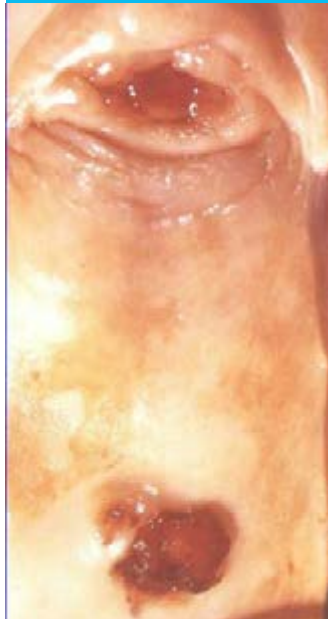
Figure 2 : Col hypoplasique (en haut) et adénocarcinome à cellules claires du vagin