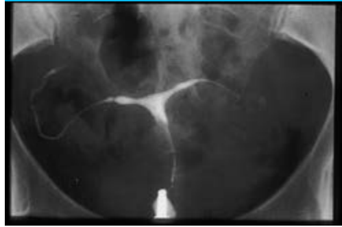
Figure 5 : utérus en T et hypoplasique