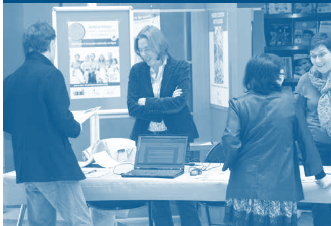
Le stand du 23 avril.