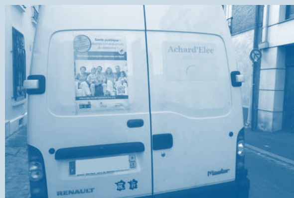
Tous solidaires : une pub qui roule à l'arrière du camion d'un artisan.