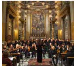
(Suite pages 6 et 7)

Le chœur italien Troubar Clair de Bordighera , accompagné de 30 musiciens de l'orchestre Note Libere de Riviera dei Fiori , interpréteront en notre honneur et pour la 1 ère fois en France, après les Etats-Unis et Rome, la composition du Maître de Chapelle américain Michael John Trotta : « Septem Ultima Verba ». Cette œuvre contemporaine, à la fois facile d'accès et puissante, est un véritable baume au cœur.